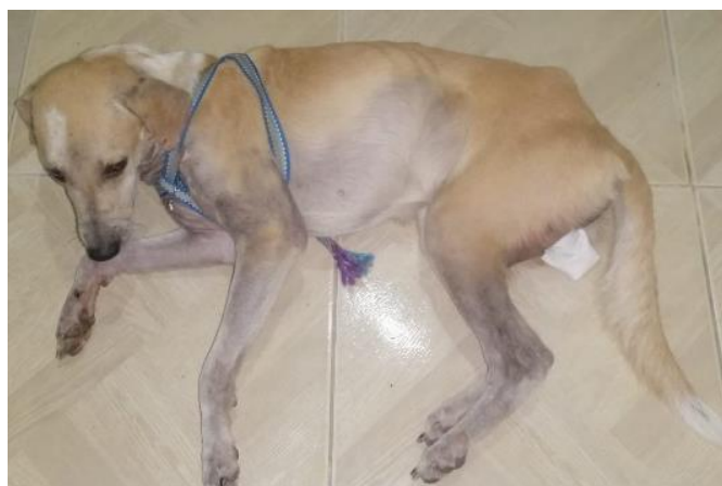
Figura 6. Evolución 2 meses pos tratamiento.

El paciente presentó una evolución satisfactoria un mes después del inicio del tratamiento. Aunque aún continúa en tratamiento y está en un nuevo hogar.