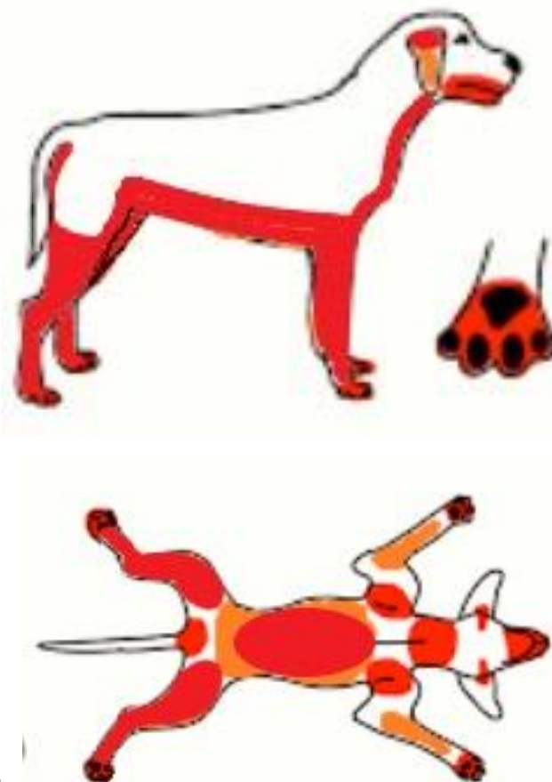
Figura 1. Dermograma.

Durante la evaluación del paciente, se pudo observar que se encontraba en estado alerta. Además, presentaba prurito y un olor desagradable. Se evidenciaron lesiones en la piel, tanto primarias como secundarias. Se observaron pápulas, eritemas que evolucionaron hacia una hiperpigmentación, liquenificación e hiperqueratosis debido a la cronicidad. También se apreciaba una alopecia localizada en áreas como las orejas, alrededor de la conjuntiva, el hocico y principalmente en el área corporal ventral del animal, afectando las axilas, ingles, miembros posteriores, anteriores y la zona ventral del cuello. Cabe destacar que el área dorsal no presentaba lesiones. (Figuras 1 y 2).