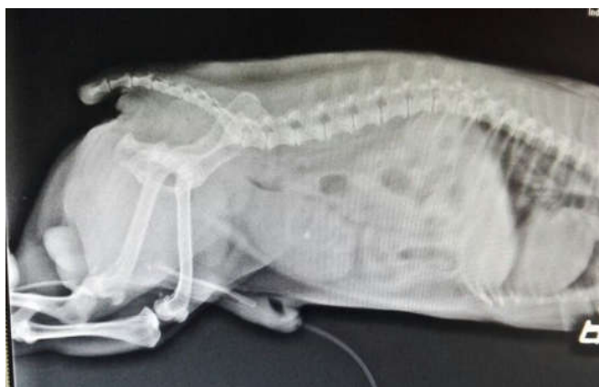
Figura 1. Radiografía abdominal lateral.

Los resultados del hemograma evidenciaron que el paciente estaba cursando un proceso de hemoconcentración reflejado en hematocrito alto, producto de la deshidratación debido a la poca ingesta de agua.